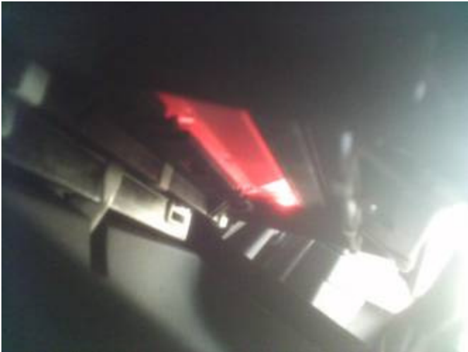
Beleuchtung ab Werk, beide Haltegriffe und Abdeckung samt Aschenbecher ausgebaut.

Bei meinem MJ 2007 war die Beleuchtung zwar eingebaut, aber nicht sichtbar. Alle anderen brauchen den Lichtleiter 8P0 857 355 für 7,50 €.